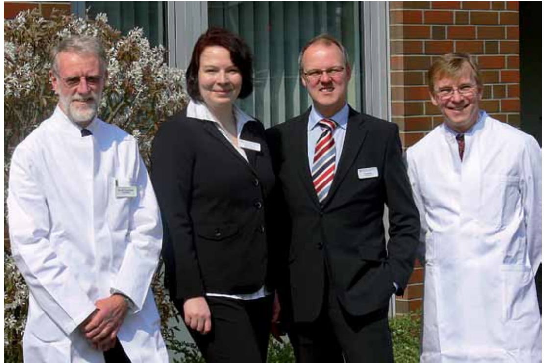
Die aktuelle Führungsspitze in Bad Schwartau.